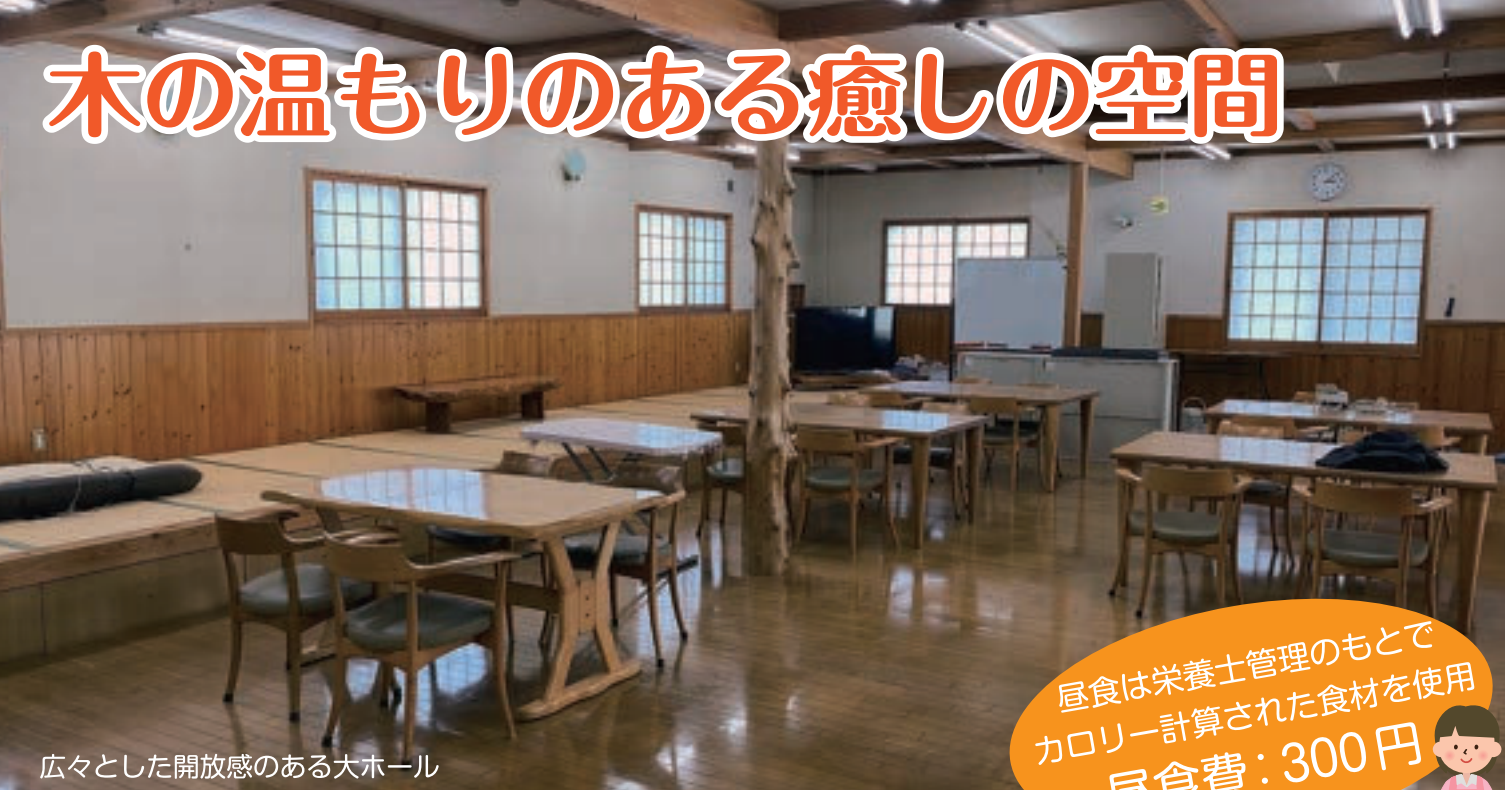
広々とした開放感のある大ホール