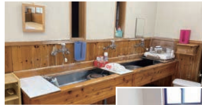
広々として使いやすい水回り スペース。トイレも4ヶ所に。