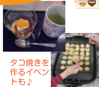
タコ焼きを 作るイベン トも♪